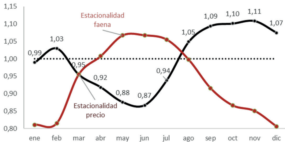
Comportamiento estacional de la faena de vacas y el precio promedio para la categoría

Estacionalidad anual de la faena de vacas medido contra la estacionalidad precio para la categoría, en base a cotizaciones promedio del MAG, expresadas en pesos constantes.